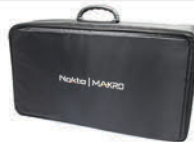
NMS20/30 휴대용 케이스