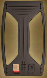
T100 پیچک کاشف جستجوی عمیق