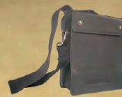
کیف چرمی حمل و نقل جعبه سیستم