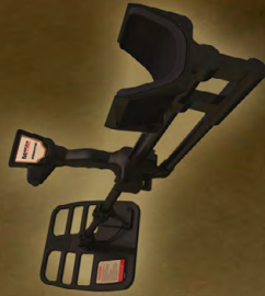
T44 پیچک کاشف عمومی