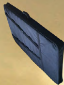
تقویت شده برای نوک جستجوی عمیق کیسه پلاستیکی کوردورا دو زیب دار