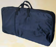
کیسه پلاستیکی کوردورا برای حمل و نقل کل سخت افزار