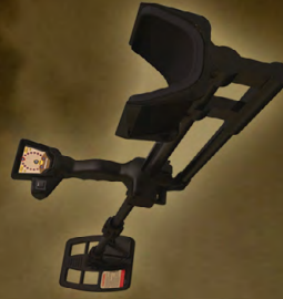
T21 پیچک کاشف سطح