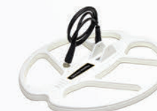
Поисковая катушка DD 40 x 35 см (15.5" x 14") (KR40)