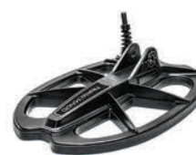
Поисковая катушка KR28 DD 28 см x 18 см (11" x 7")