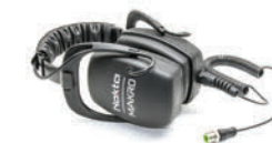
Водонепроницаемые наушники Подходят для удобного поиска как на земле, так и под водой.