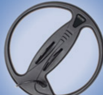
C28 Coil (Paquete Estándar) 28 cm (11") 550 gr (1.2 lb.) (19.4 oz.)