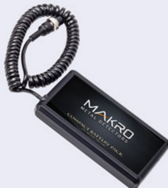
The device is delivered with 8 AA Alkaline batteries.