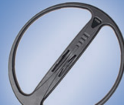
C45 Coil (Paquete Profesional) 39x45 cm (16"x18") 850 gr (1.9 lb.) (30 oz.)