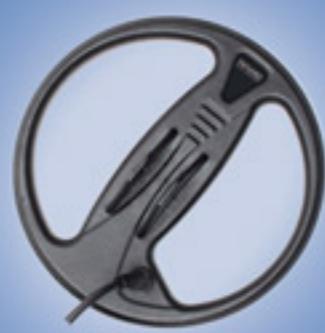
Bobina C23 (Paquete Profesional) 23 cm (9") 460 gr (1 lb.) (16 oz.)