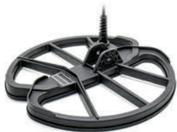
Wodoszczelna cewka DD wraz z osłoną 28cm / 11" (AF28)