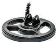
KR18C okrągła wodoszczelna cewka CC 18cm / 7"