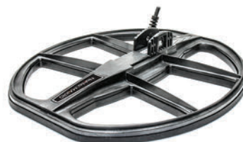
KR40 eliptyczna wodoszczelna cewka DD 40x35cm / 15,5"x14"

Wszystkie cewki posiadają dedykowaną osłonę.