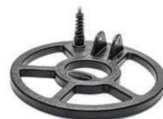
AF23C okrągła wodoszczelna cewka CC 23cm / 9"