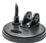
KR13 okrągła wodoszczelna cewka DD 13cm / 5"