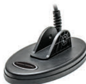
KR19 eliptyczna wodoszczelna cewka DD 19x10cm / 7,5"x4"