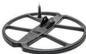
AF35 eliptyczna wodoszczelna cewka DD 35x33cm / 13,5"x13"