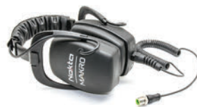
Słuchawki wodoszczelne Wygodne użytkowanie na lądzie jak i pod wodą.