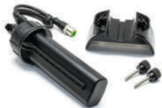
Wodoszczelny pojemnik na baterie AA Umożliwia zasilanie dodatkowymi bateriami 4xAA (nie zawiera baterii).