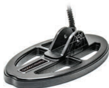
KR24 eliptyczna wodoszczelna cewka DD 24x13cm / 9,5"x5"