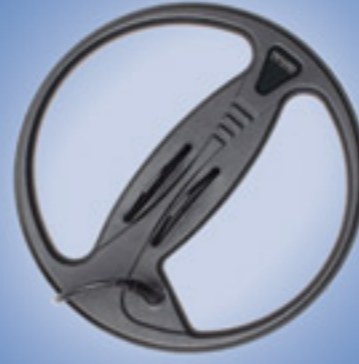
قرص البحث C28 (Standard Package)