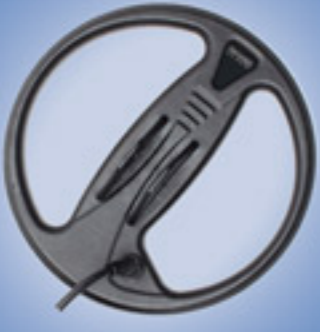
قرص البحث C23 (Pro Package)