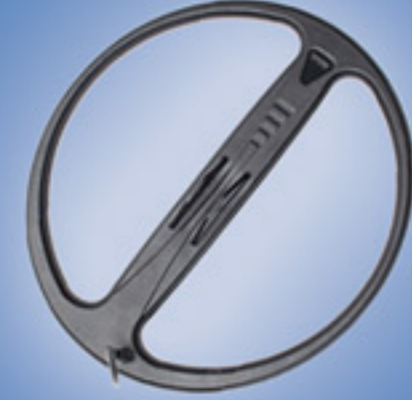
قرص البحث C45 (Pro Package)

39x45 cm (16"x18") 850 gr (1.9 lb.) (30 oz.)