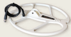
40 cm x 33.5 cm (15.5" x 13")