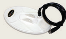
26 cm x 14 cm (10" x 5.5")

Casque Wireless 2.4 GHz et Module (optionnel)