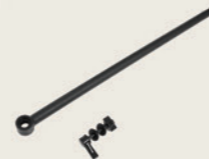
Bas de Canne Supplémentaire