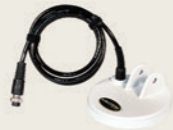
Disque DD : GR13 13 cm (5")